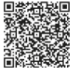
(PC)-C (Account consolidate form)