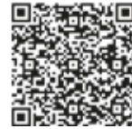
(PP) (ECA transfer form)