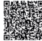
(PM) (Fund transfer form)